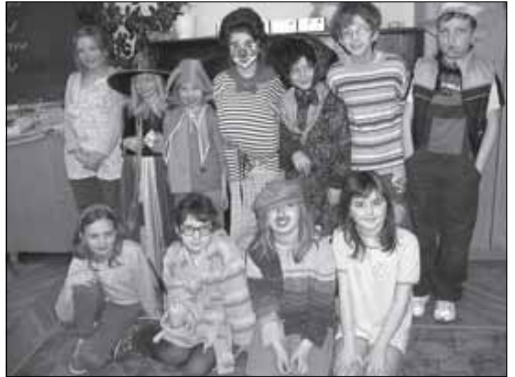
Dobrou náladu rozdali žáci ZŠ Dolní Třešňovec i dětem z místní MŠ.