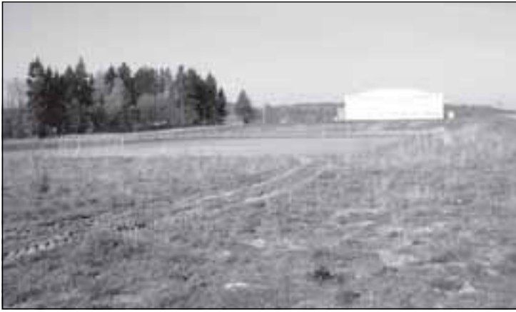
Tady vznikne stadion, který bude sloužit fotbalu a atletice.