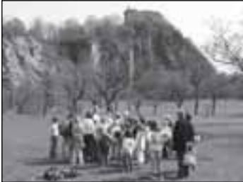
Děti - str. 9 - 11