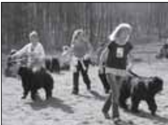
Novofundlandští psi se sešli v Oboře - str. 13

Aktuality z Lanškrounska: http://aktualne.mesto-lanskroun.cz/