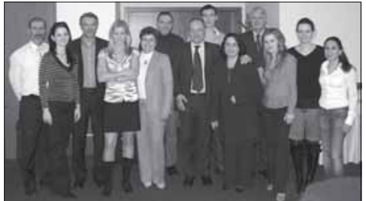
Fotografie je z úvodního setkání k tomuto projektu, které se konalo v Bratislavě v polovině března (zástupci všech pěti zúčastněných zemí).