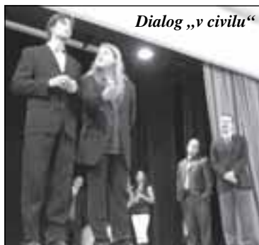
Dialog „v civilu“