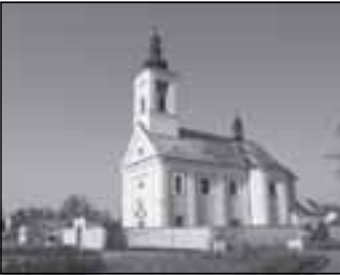
Fasáda kostela v Žichlíneku získala ocenění - strana 7