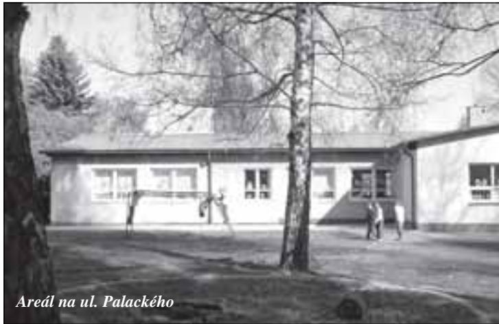
Areál na ul. Palackého

Rada města schválila převod finančních prostředků ve výši Kč 395 000,- z rezervního do investičního fondu Základní školy Lanškroun v ul. B. Smetany, finance budou použity na školní dětské hřiště v areálu školy v ul. Palackého.